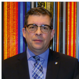
Ihr Frank Helmenstein Bürgermeister der Stadt Gummersbach